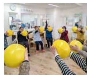
「クノンボール」体験会の様子

メンバーは、30代から80代までの女性18名。「学び、話し合い、そして行動しよう」という目標を共有し、自ら研鑽を積みながら、共感することでチーム全体が成長しています。また各々のメンバーは、会の活動以外にも多くの分野に積極的に参画し、地域に根差した活動に関わっています。活動を続けることでつながりを切ることなく、互いに分り合える仲になっています。