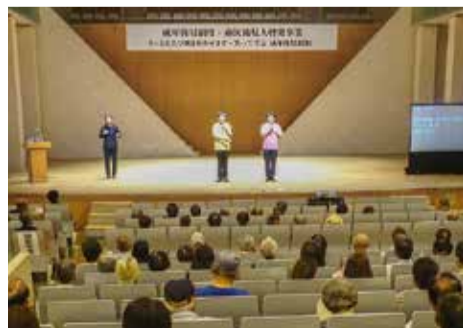
成年後見制度 市民後見人啓発事業

栃木市内のボランティア団体・福祉団体への活動補助や福祉教育推進事業・福祉活動事業等