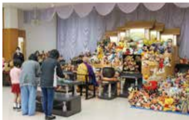
人形供養祭の様子

特に同センターが運営する「みどりの会」では葬儀に関する不安を少しでも減らせるよう、日頃から暮らしの相談に乗るなど、地域の方々の心強い味方になっています。