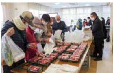
新鮮野菜市の様子

「助け合い」の精神を大切にするJA しもつけの活動は、まさに地域の福祉を支える大きな力となっています。地域になくてはならない存在として、これからも共に歩んでいけることを心から願っています。