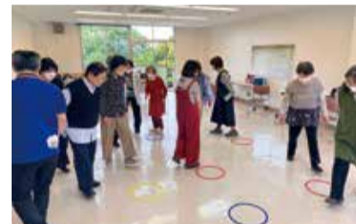
「リトミック」の研修の様子

半世紀という長い間続く秘訣は「メンバー同士が共通認識を持つこと」と「お互いにできる範囲で活動すること」です。同じ目標に向かって幅広い年代が集まり、活動することで、地域の世代をつなぐ場にもなっており、この顔の見える関係が、普段の助け合いにもつながっています。