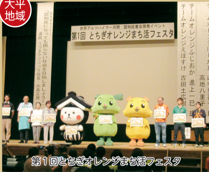
第1回とちぎオレンジまち活フェスタ