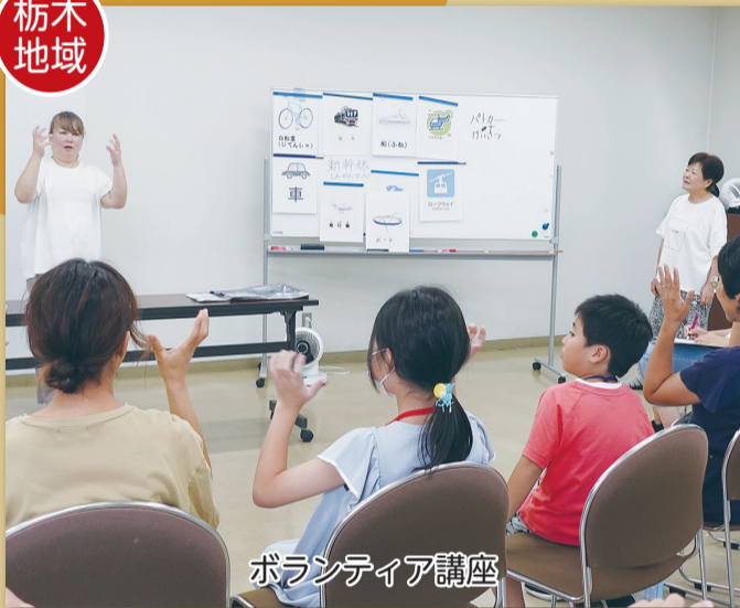
ボランティア講座