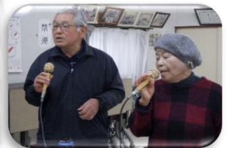
「お母さん迎えに来たよ～」

ポイント～1週間後もまた会える～ 信頼できる仲間との 集まる場所があるからこそ 自分の役割が果たせる！