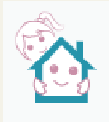
ケアマネージャー